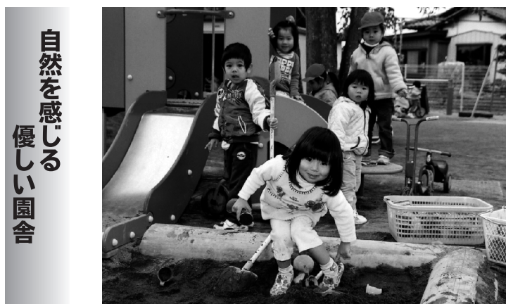
自然を感じる 優しい園舎

園長先生が木造に拘った、四角と円柱の積木を組み合わせたようなユニークな園舎には、様々な仕掛けがありました。玄関を入りまず目に入ってくるのが、発電量を示す計器です。グリーン電力基金によるソーラーシステムを設置しているので太陽の力を目で見て感じ、電力としても活用できるようになっています。左方向に進むと乳児室があります。庭に面したデッキスペースは、お天気の良い日は日光浴もできる遊び場となります。床