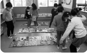
②のぞみ文庫のプレゼント